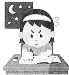
チャンカインチン

私は3年間日本語を勉強しています。外国人向けの日本語能力試験と呼ばれる試験があります。年に2回、7月と12月の第一日曜日に行われます。日本語能力試験はN5からN1まであってN1が一番難しいです。「N」は日本語のNです。最初N3を受けて合格しました。それから去年7月N2の試験を申し込んで一回失敗しましたが諦めずに勉強を続け、12月にN2を取りました。今度7月三日にN1を取得する為にまた試験を受けます。今はとても緊張しています。しかし、結果はどうであれ、すべての試験は私にとって経験を積む機会である為に最善を尽くします。